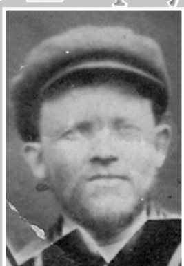
ГАЛКИН Иван Григорьевич (1900 – 1943)