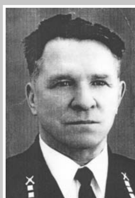
КОВЫРЗИН Иван Афанасьевич (1914 – 1981)