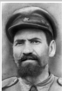
ДАНИЛОВ Михаил Яковлевич (1892 – 1950)