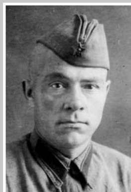
ЗЕЛЕНОВ Николай Иванович (1908 – 1944)