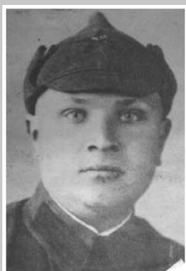
ИГОНИН Александр Алексеевич (1919 – 1945)